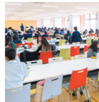
コミュニティホール