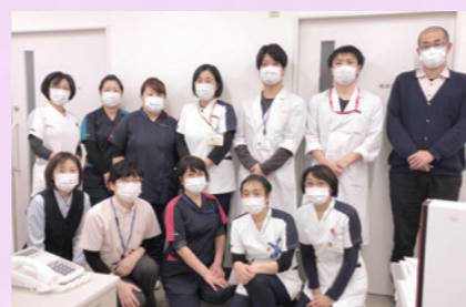
つなごうてのスタッフ