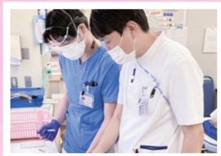
院内 救急救命士 との協働