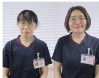
糖尿病看護認定看護師(左)、 認知症看護認定看護師(右)