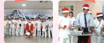
職員によるコンサートで幕を開けたクリスマス会