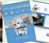
学んだことが書き込めるファイルをプレゼントしました