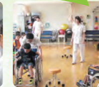
初めての車椅子の操作に四苦八苦!?