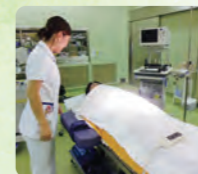
手術台に上がってみますドキドキ!