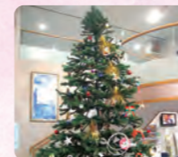
大きなツリーがロビーを彩ります