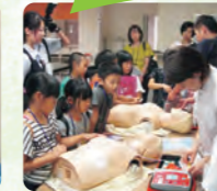
AEDの使い方を教わり、体験しました