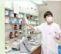
たくさん種類がある薬の調合方法を紹介します