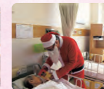
患者さんに院長サンタがプレゼントを届けました