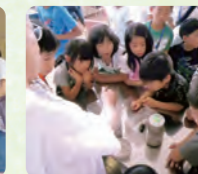
おみやげは副院長が飼育したオオクワガタ!