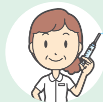
予防接種を受けよう!