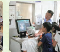
ラジコンを使ったレントゲン撮影のデモンストレーション