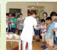
いろいろな病院食を試食味はどうか?