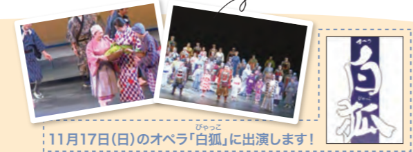
11月17日(日)のオペラ「白狐」に出演します！

例年秋頃、妙高市文化ホールで「オペラ」の上演が行われます。そのバックコーラスは一般市民から募り、日舞同様3年前から参加しています。演出家と一緒に舞台作りができることは貴重であり、週1回の練習で思いっきり歌うこともストレス発散になっています。そして今年は11/17(日)にオペラ「白狐(びやっこ)」上演に向け、こちらも全力で取り組んでいます！