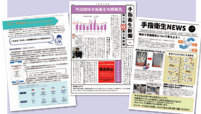
ICTニュース・手指衛生新聞・手指衛生NEWSなど 様々な情報を発行配布