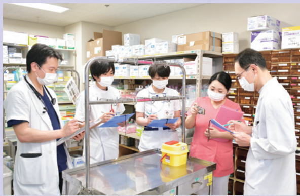
感染制御チームの定期ミーティング