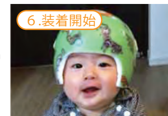
6.装着開始 ヘルメットは約230gと軽く、赤ちゃんもすぐに慣れて1日20時間前後装着できるようになります。