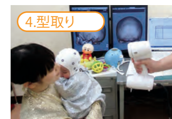
4.型取り 型取りのためのスキャニングは、痛みもなく安心です。