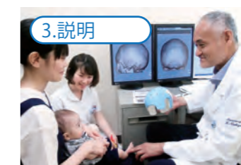
3.説明 治療方法などを丁寧に説明します。治療は首が座った頃の生後3~6カ月の赤ちゃんが対象です。