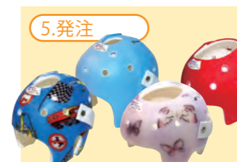
5.発注 さまざまな色やデザインから好きなものを選べます。